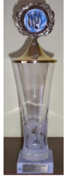
Die Siegreiche Damenmannschaft